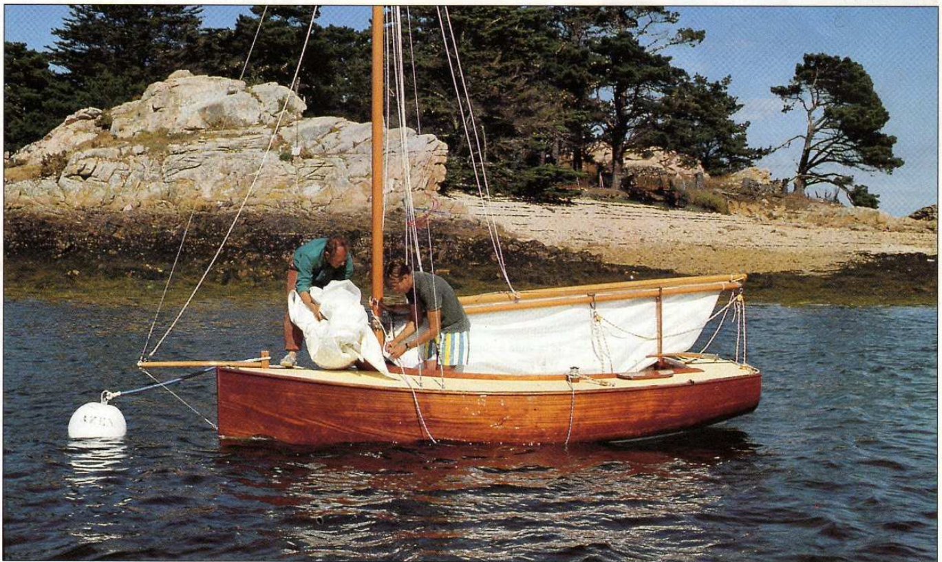
Pen Azen devant l'île Logodec, dans le petit mouillage de la Chambre.

La coque et les espars ont reçu huit couches de vernis. Le pont est protégé par une peinture antidérapante passée sur un primaire alu. Quant aux œuvres vives, une couche d'anti-fouling blanc recouvre une sous-couche de même couleur. L'ensemble de ces produits est du type polyuréthane mono-composant bien adapté aux constructions en bois classique. Le plancher a été traité avec un produit de saturation, cinq couches de Deks Olje .